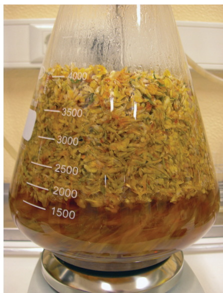
Figura 3 Pormenor do Erlenmeyer do sistema de hidrodestilação laboratorial, evidenciando a água de decocção.

Uma vez obtido o óleo essencial, é importante fazer a sua análise, com vista à identificação e quantificação dos seus constituintes. Existem diversas técnicas disponíveis para a análise de extratos vegetais (Rubiolo et al. 2010), sendo a cromatografia gasosa (CG em Português, GC em Inglês) a metodologia de eleição para a análise quantitativa dos componentes de um óleo essencial, e a cromatografia gasosa acoplada a espectrometria de massa (CG-EM em Português, GC-MS em Inglês) a metodologia apropriada à identificação dos